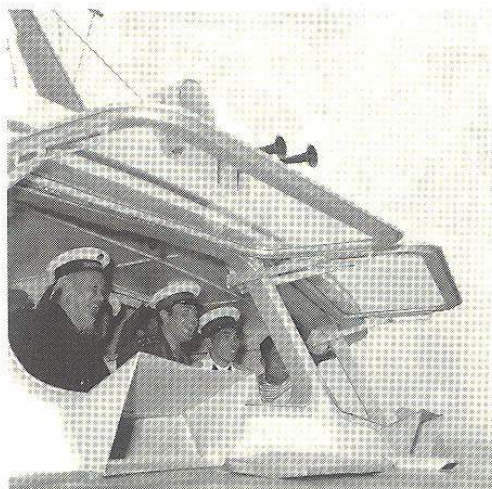
Chủ tịch Hồ Chí Minh chụp ảnh chung với Anh hùng Gherman Stepanovich Titov, năm 1962