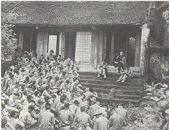
Chủ tịch Hồ Chí Minh nói chuyện với cán bộ, chiến sĩ Đại đoàn Quân tiên phong tại Đền Hùng: “Các vua Hùng đã có công dựng nước Bác cháu ta phải cùng nhau giữ lấy nước”, ngày 19/9/1954