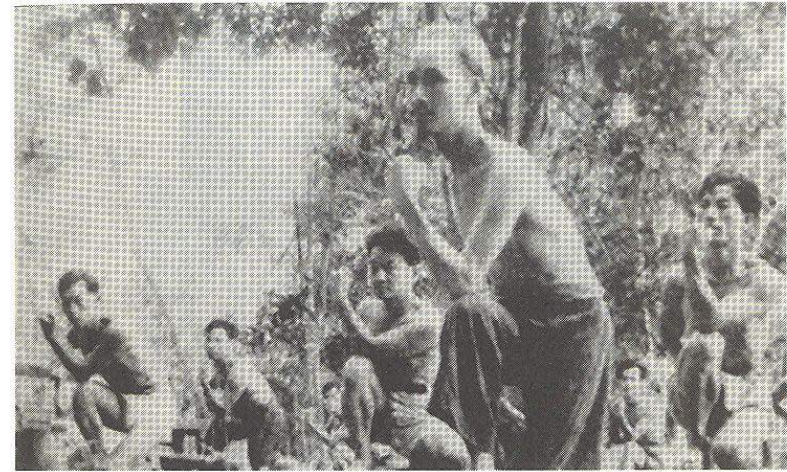
Chủ tịch Hồ Chí Minh tập luyện cùng các chiến sĩ sau giờ làm việc ở chiến khu Việt Bắc, năm 1948