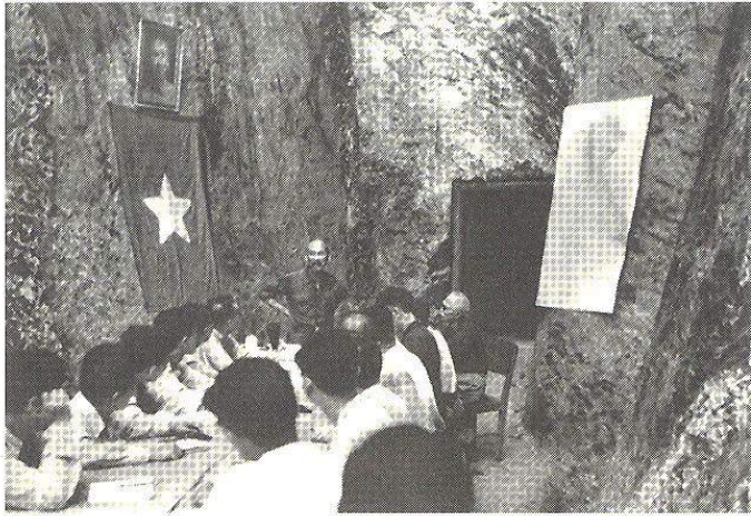
Chủ tịch Hồ Chí Minh tại cuộc họp Hội đồng Chính phủ sau Chiến thắng Điện Biên Phủ tại xã Kim Quan, huyện Yên Sơn, Tuyên Quang, ngày 02/7/1954