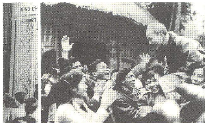
Các đại biểu Đại hội thống nhất Việt Minh - Liên Việt chúc mừng Chủ tịch Hồ Chí Minh được suy tôn là Chủ tịch danh dự của Mặt trận Liên Việt, tháng 3/1951