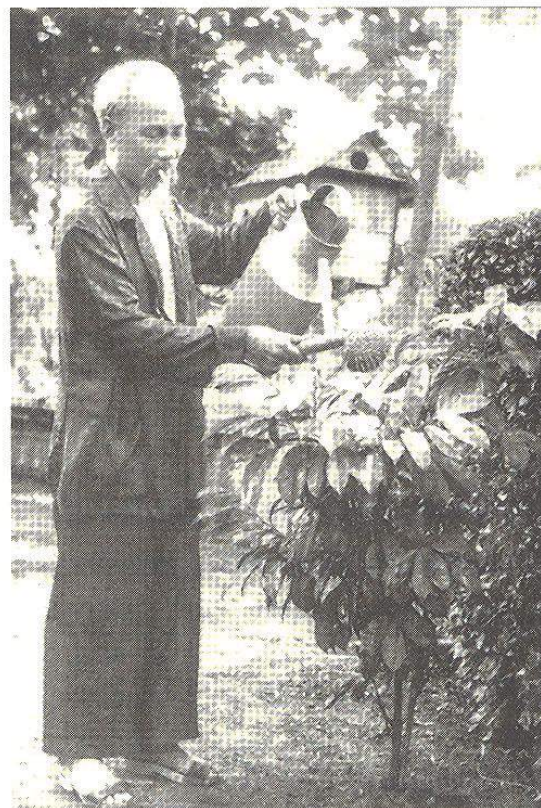
Chủ tịch Hồ Chí Minh chăm sóc cây vú sữa của đồng bào miền Nam kính tặng Người nhân dịp Tết Nguyên đán năm 1955