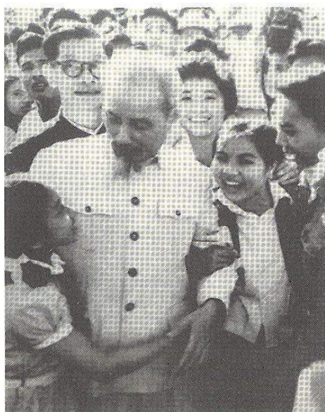
Chủ tịch Hồ Chí Minh đến cảng Hải Phòng thăm bà con Việt Kiều ở Thái Lan về nước chuyến đầu tiên, ngày 10/01/1960