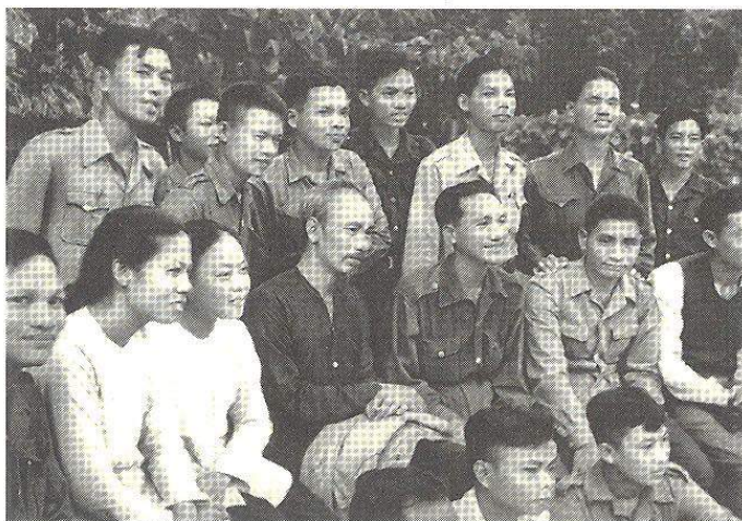
Chủ tịch Hồ Chí Minh tiếp đoàn cán bộ Nam Bộ tại Việt Bắc trong kháng chiến chống Pháp, tháng 10/1949