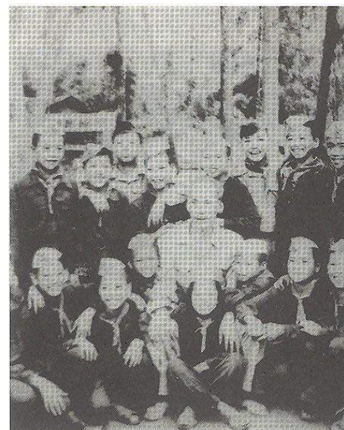
Chủ tịch Hồ Chí Minh dự Đại hội thiếu nhi ở Việt Bắc trong kháng chiến chống Pháp