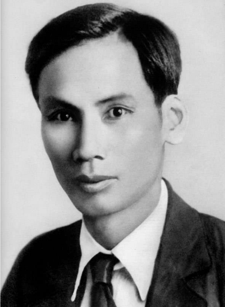
NGUYỄN ÁI QUỐC ở Liên Xô (1923)